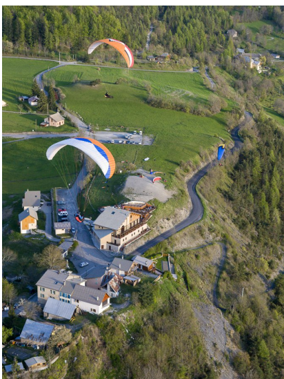
PHOTO : Le décollage l'atterrissage et le parking en un coup d'oeil

La rançon de ce succès est la sur-fréquentation qui peut en résulter ...